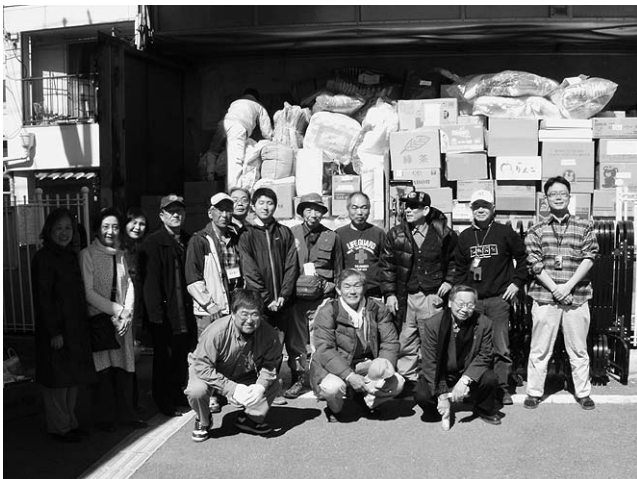
現地へ向かう教役者・シニア信徒と教区支援センターの皆さん (4月4日朝10時、聖贖主教会牧師館前)

教区では、近々、救援支援復興募金の教区目標額を決めて、長期にわたりこれを継続していきたいと考えております。どうぞ、この点につきましても、各位のご理解とご協力をよろしくお願い申し上げます。