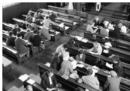
グループごとに分かち合い

礼拝を体感しました。中でも「勧話」または説教にかえて当日のみ言葉を分かち合ってもよい」という設定では、参加者はグループに分かれてそれぞれ神様から与えられたみ言葉について分かち合いました。20分間ひたすらみ言葉に耳を傾けあうことができたように思います。その後、質疑応答や感想など意見が出され、今後各教会で「み言葉の礼拝」をどのようにするかは、牧師の指導の下進めていくことを確認しました。